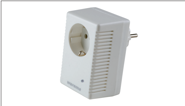
Abb. 1 WMS Steckdose

Die WAREMA Mobile System (WMS) Steckdose ermöglicht die drahtlose Fernbedienung von Leuchten mit herkömmlichem Schutzkontaktstecker. Hierzu sind keine Elektroinstallationsarbeiten notwendig, die WMS Steckdose wird einfach in die bestehende Steckverbindung eingefügt.